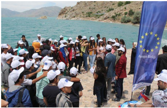
WED Etkinliği Akdamar Adası, Van

WED (Dünya Çevre Günü) , tüm dünyada çevrenin korunması konusunda bilinç uyandırmak ve eyleme geçmeyi teşvik etmek adına Birleşmiş Milletler'in en önemli günüdür. Ayrıca, Aralık 2015'te Paris İklim Değişikliği Anlaşması kabul