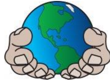
Dünyanın kaderi ellerimizde

Söz konusu onamaya onay verilmesi ile birlikte Anlaşma, yürürlüğe girmesi için gereken, küresel emisyonların %55'inden sorumlu olan 55 tarafın bulunması eşliğini geçmiş oldu. Bu da Anlaşmanın, Marakeş'teki BM İklim Değişikliği Konferansında yürürlüğe gireceği anlamına geliyor.