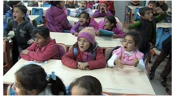
AB tarafından açılan bir okuldaki Suriyeli çocuklar

Avrupa Komisyonu, Eylül ayında Türkiye'deki Suriyeli mültecileri ve ev sahibi toplulukları sağlık ve eğitim alanlarında desteklemek amacıyla, 600 milyon € tutarında iki adet doğrudan hibe sözleşmesine imza atmıştır. Söz konusu hibeler, Milli Eğitim Bakanlığı ile Sağlık Bakanlığı tarafından kullanılacaktır.